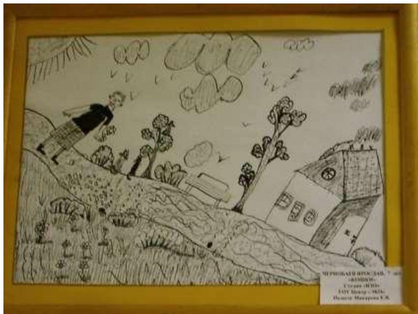
Рисунок гелевой ручкой отличается от карандашного тем что практически невозможно сделать плавную штриховку. Техника рисунка гелевой ручкой получается ближе к гравюрной. В результате исключается растушевка, зато активно используется перекрестная штриховка, изогнутые и фигурные штрихи.

Преимущество гелевых ручек в чёткости и контроле над рисунком. С их помощью можно добиться очень аккуратного исполнения. Правда, это длительная и трудоемкая работа, так как штриховка бывает разной, она может быть точечной, что делает работу куда сложнее, но эффект себя оправдывает. Как в любой технике, так и в этой есть свои нюансы, ручка при длительной работе немного мажет, поэтому ее периодически требуется очищать. Рисунок выполняется как черной, так и цветными ручками. Все зависит от вашего воображения, настроения и идеи.