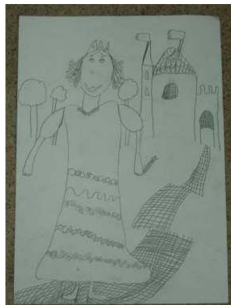
Рисунок в живопись составляет обычно начальную стадию выполнения произведения и играет важнейшую роль в определении очертаний, формы, объёма предметов и расположения их в пространстве. Поэтому

Карандашный рисунок (англ. drawing), какое-либо изображение на плоскости, выполняемое от руки с помощью графических средств - контурной линии, штриха , пятна. Различными сочетаниями этих средств (комбинации штрихов, сочетание пятна и линии и т. д.) в рисунке достигаются пластическая моделировка, тональные и светотеневые эффекты рисунка, как правило, выполняется одним. Сфера применения рисунка чрезвычайно обширна (рисунок научно-вспомогательного, прикладного, технического характера); художественный рисунок составляет одну из важнейших и широко развитых областей изобразительных искусств и лежит в основе всех видов художественного изображения на плоскости (живопись, графика и пр.).